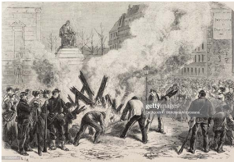
صحنه به آتش کشیدن گیوتین در مقابل مجسمه ولتر

انقلاب کبیر بورژوایی فرانسه گیوتین را تحویل جامعه داد. دستگاهی که به مثابه بهترین ابزار قتل در خدمت کشتار به کار گرفته شد. انقلاب کارگری کمون پاریس این سمبل توحش سرمایه داری را به آتش کشید.